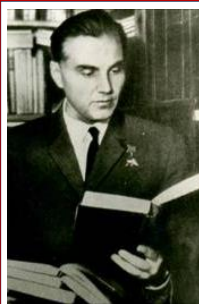
Активный участник Великой отечественной войны

к 105-летию со дня рождения советского педагога-новатора, писателя, публициста, создателя народной педагогики. Героя Социалистического труда, член-корреспондента Академии педагогических наук (АПН) СССР, кандидата педагогических наук.